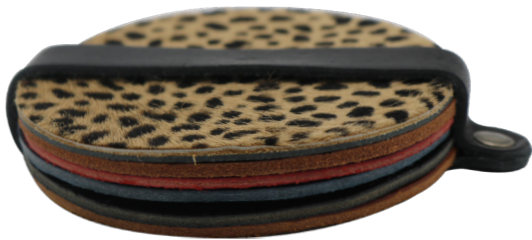
Muller & Sons onderleggers

Gemaakt van het restmateriaal van onze riemen, zijn deze onderleggers een prachtige aanvulling op iedere koffietafel. Het pakketje bestaat uit 6 onderzetters in verschillende printjes en kleuren. Alle setjes zijn uniek. Het geheel is afgemaakt met een stoer bandje dat alles bij elkaar houdt.