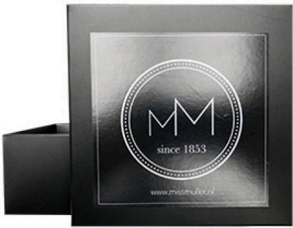
Box voor riemen

Deze luxueus vormgegeven box maakt van de riemen van Muller & Sons en Miss Muller een echt cadeau. Een stukje extra luxe om uit service mee te geven aan de klant of te gebruiken als cadeauverpakking. Verkrijgbaar voor beide merken.