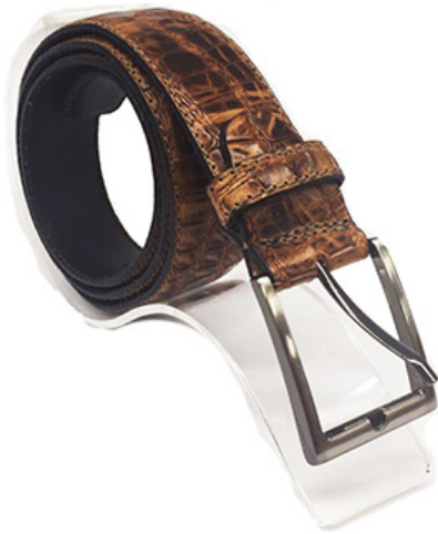
Cederspanner met Zilverknop

Met deze riemhouder kunt u riemen op overzichtelijke wijze in uw winkel presenteren. Omdat de houder transparant is, leidt deze niet af van de riem. Het model zorgt ervoor dat materiaal, print en de gesp allemaal goed zichtbaar zijn.